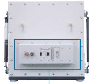
I/Fモジュールを取り付けたMY2510